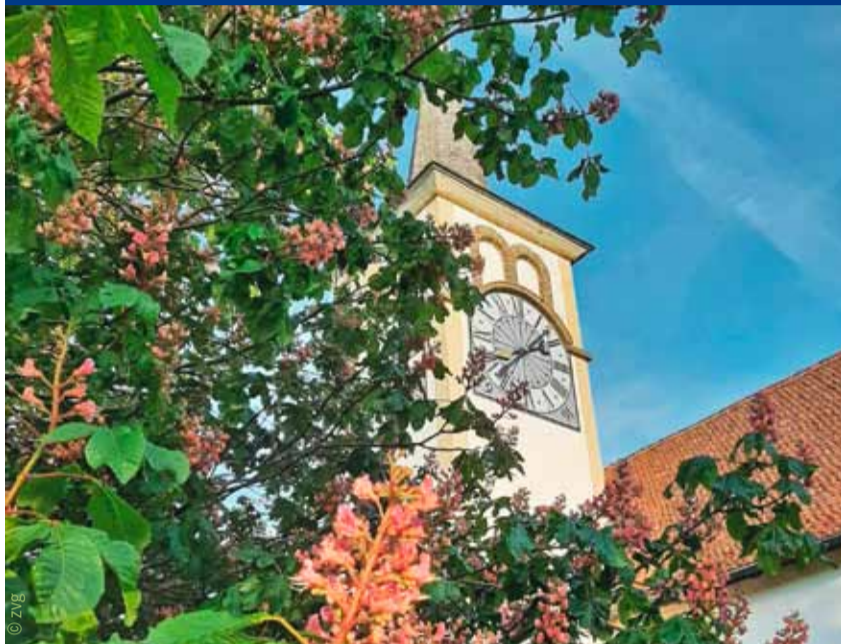
GOTTESDIENSTE IM AUGUST