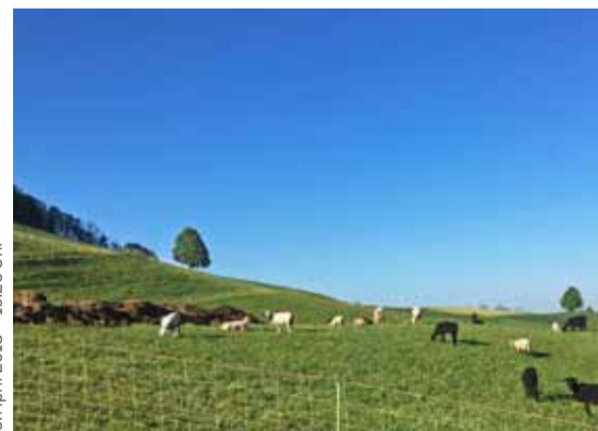
Frühling und Sommer