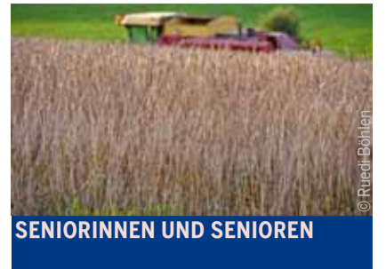
SENIORINNEN UND SENIOREN